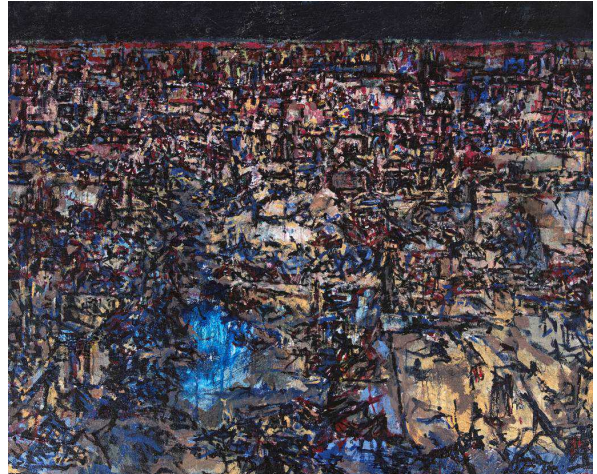
Tammam Azzam, Untitled, 2021, Acryl auf Leinwand, 140 x 170 cm

Galerie Kornfeld Fasanenstraße 26 10719 Berlin