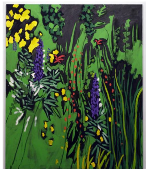
Unknown Orange Flower against Green, 2008 Acryl und Öl auf Leinwand, 225 x 200 cm