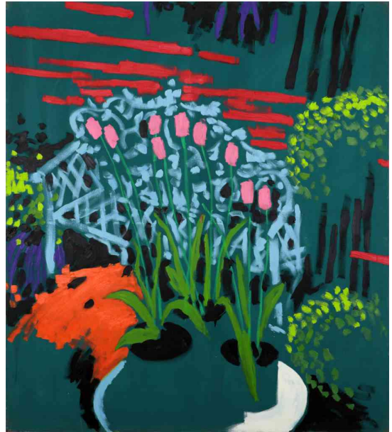
Untitled (The Black Garden Paintings), 2009 Acrylic and oil on canvas, 171.5 x 152.4 cm