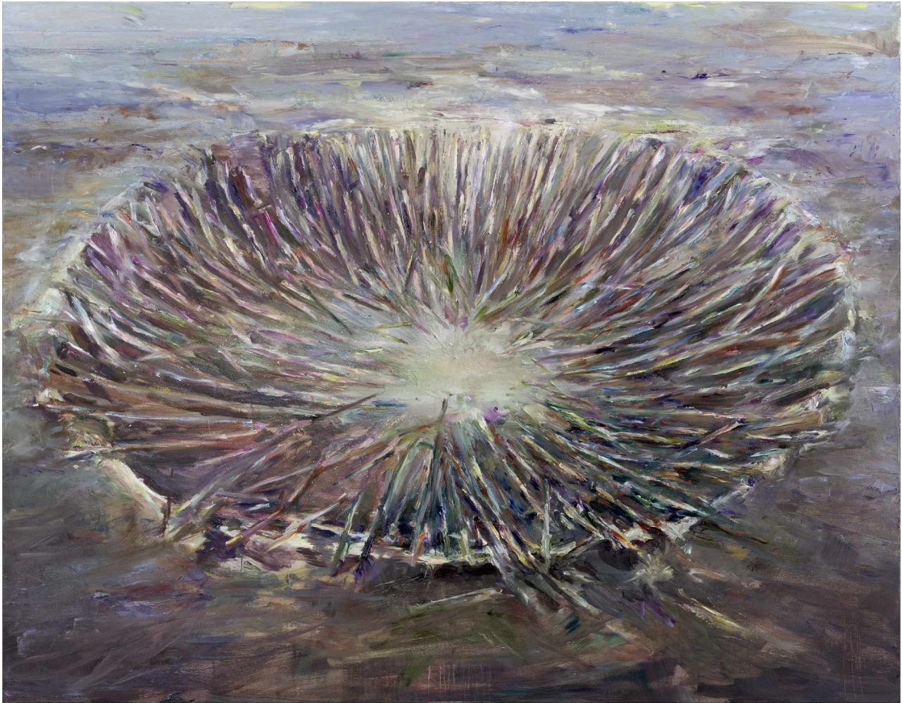
Krater, 2013, Öl auf Leinwand | Oil on canvas,

Die kraftvollen und intensiven Bilder von Franziska Klotz (*1979 in Dresden) lassen das uralte Medium der Malerei auf neue Weise lebendig werden.