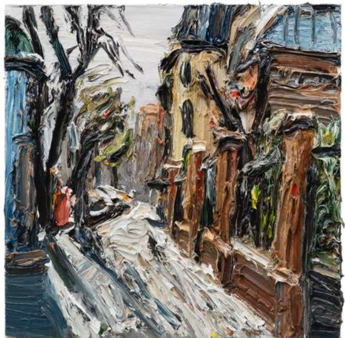
Gegenlicht Fasanenstraße, 2020, oil on canvas, 60 x 60 cm

www.galeriekornfeld.com facebook and instagram: kornfeldgalerie