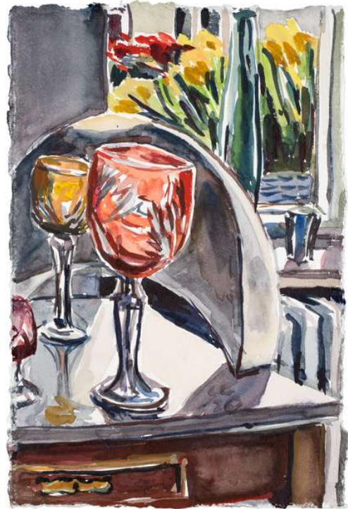
Sonnige Gläser, 2020 Aquarell auf Bütten, 30 x 20 cm

kornfeld@galeriekornfeld.com +49 30 889 225 890