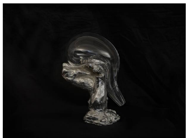
Susanne Roewer: Twilight, 2020