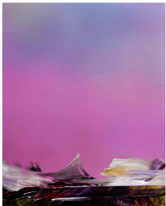
Hubert Scheibl, Badland , 2019, Öl auf Leinwand, 150 x 120 cm

galerie@galeriekornfeld.com www.galeriekornfeld.com https://www.facebook.com/kornfeldgalerie/